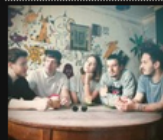
BAND TO WATCH

Updates Julian Casablancas y Tyler the Creator en Ceremonia